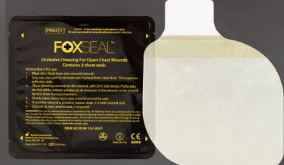
フォックスチェストシール (弁無し)