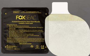
フォックスチェストシール (弁有り)