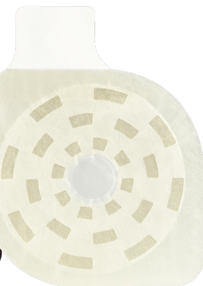
フォックスチェストシール(弁付き 1枚入り)