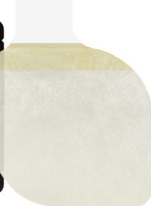
フォックスチェストシール(弁なし 2枚セット)