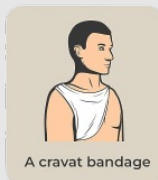
A cravat bandage