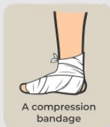
A compression bandage