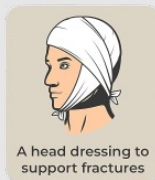
A head dressing to support fractures