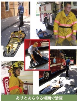
ありとあらゆる場面で活躍