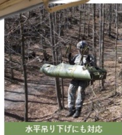
水平吊り下げにも対応

米軍をはじめ、世界各国の救急ドクターヘリで採用されている負傷者搬出用の引き摺り型担架です。航空機によるホイスト（吊り下げ）に対応したスレッドです。患者を保護するデザイン、また本体素材の HDPE は起伏の激しい地形での引きずりに対しても高い耐性があります。垂直 / 水平での吊り下げいずれも対応可能でありストラップ強度は約 4 トンです。