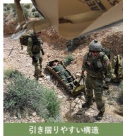
引き摺りやすい構造