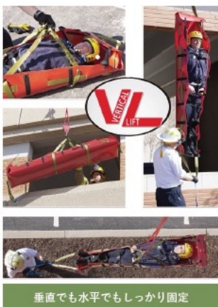
垂直でも水平でもしっかり固定