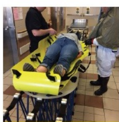
迅速な繰り返し使用が可能