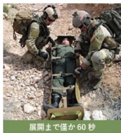
展開まで僅か 60 秒