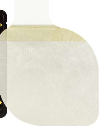
フォックスチェストシール(弁なし 2枚セット)