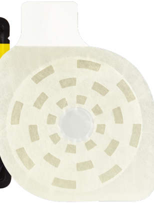
フォックスチェストシール(弁付き 1枚入り)