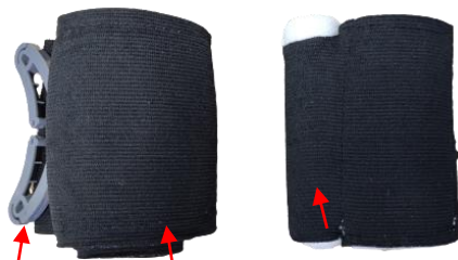
プレッシャーバー 伸縮包帯 プレッシャーパッド

左：4インチレスポonderフレックスバンデージ 右：4インチファーストエイドバンデージ