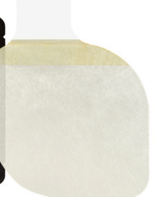
フォックスチェストシール(弁なし)