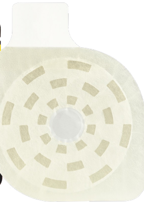
フォックスチェストシール(弁付き)